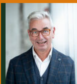
Willem Janssen Makelaar & Taxateur Wonen